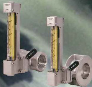
フローセル流量計 NFLシリーズ