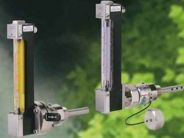
空調設備用流量計 ピトーセル流量計