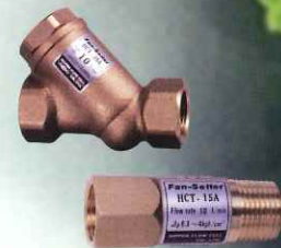
ファンコイルユニット用定流量弁 Fan-Setter