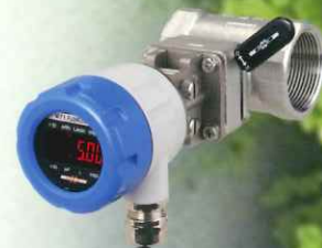
2線式差圧流量計 マイティーフローセル