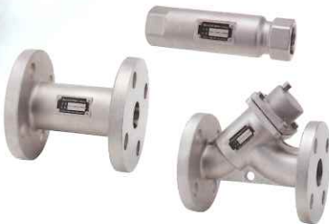
設定流量固定型定流量弁 リンセルバルブ