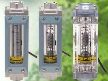
警報スイッチ付流量計 フロースイッチ