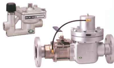
設定流量可変型定流量弁 フローマチックバルブ