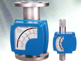
金属管式面積流量計 V/Aフローター・V/Pパージメータ