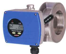
気体用質量流量計 サーマルフローセル