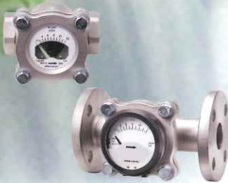
フラップ型流量計 フラップフローセル