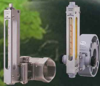
フローセル流量計