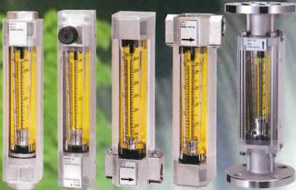
面積流量計 NSPシリーズ