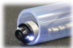
高圧洗浄ホース一体型カメラ 「配管くん」